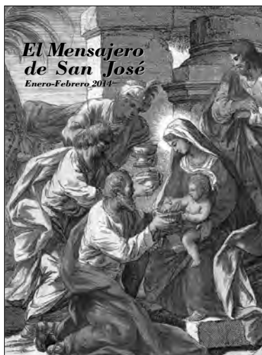
Epifanía J. C. Sepulcro Real. Oratorio de Caballeros de Gracia, Madrid.

REVISTA DE LAS ASOCIACIONES JOSEFINAS DE ESPAÑA