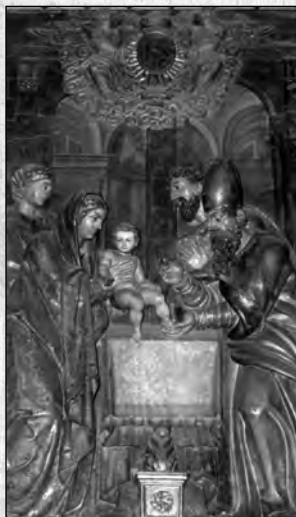
«Circuncisión» de Adrián Álvarez, 1595. Real Iglesia de S. Miguel y S. Julián de Valladolid.

actual iglesia de San Miguel solo se salvó en este relieve de la circuncisión, quizás por formar parte de una escena evangélica. A pesar de los cambios litúrgicos del Vaticano II, los villancicos populares continúan recordando a «Manolito, chiquito, rey de los cielos [...] que dicen que es más bonito que el de Juanito, el de Isabel».