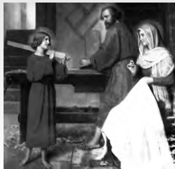
El hogar de Nazaret, el Colegio donde se formó Jesús.